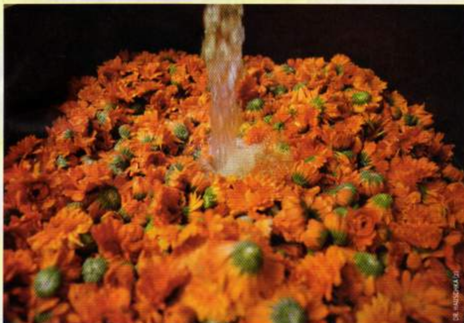
Essenzherstellung bei Dr. Hauschka.