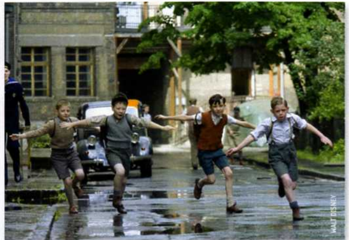
Kindheit im Nazideutschland. Flieger spielen und Stacheldraht entdecken.